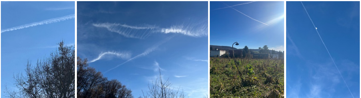
mit duschkopf ☺

kondensstreifen bemalen den Himmel spitze nadeln mit weissen fäden anfangs noch eine doppelinie, überholen verboten später wieder erlaubt winde verwischen sie zu einer strickreihe mit herausgerutschter nadel die sich nach und nach in eine wirbelsäule verwandelt einseitig wachsen rippen nach oben plötzlich ähnelt sie dem röntgenbild beim zahnarzt eine weitere nadel nähert sich sticht senkrecht durch den backenzahn gen süden eilend zur dna-spirale aufgeplustert fast nicht mehr von einer wolke zu unterscheiden stundenlang könnte ich hier liegen unzählige himmelsgemälde bestaunen marienkäfermond an weissen halmen wäscheleinen, burberry-schals kreuze, verirrte spermien alles dabei und doch ist der allerschönste himmel einfach nur blau